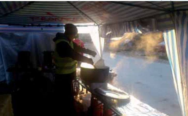
Vorbereitung des Teeausschanks

„Als wir täglich die schlimmen Nachrichten hörten und sahen, wollten wir akut helfen. Wir fanden heraus, dass im südserbischen, aber mehrheitlich albanisch besiedelten Aufnahmezentrum Preševo nahe der mazedonischen Grenze Freiwillige dringend gebraucht wurden, und machten uns auf den Weg“, so Goetz.