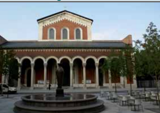
Krypta St. Bonifaz, München, Karlstr. 34, 18:00