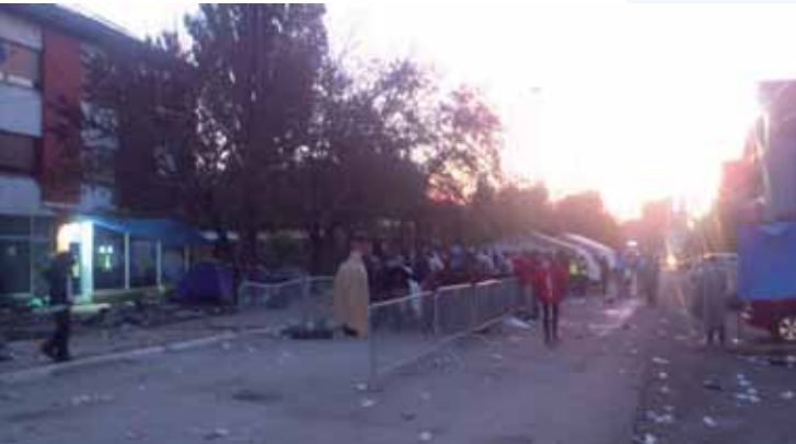
Beginn der Werteschlange vor der serbischen Registrierungsstelle

Die Hilfsbereitschaft sei überall sehr groß gewesen. Die örtlichen Helfer – zum Teil selbst arm und einige ehemalige Jugoslawienflüchtlinge – waren hauptsächlich tagsüber im Einsatz, die internationalen während der Nächte. Die Zusammenarbeit und