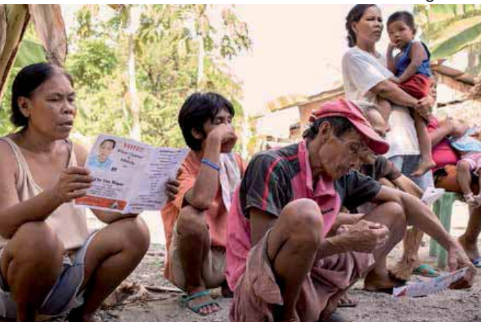
Indigene hören sich die Wahlkampfrede ihres Dorfvorstehers an

Das Projekt „Menschenrechte und Anwaltschaft für Frieden mit Rechtshilfe für indigene Völker und Kleinbauern“ ist aus langjährigen Erfahrungen in der Unterstützung lokaler Gemeinschaften erwachsen und hat folgende Komponenten: