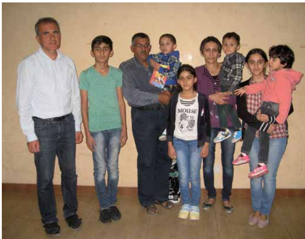
Clemens mit der christlichen Familie Jando in Amman, die aus Irak vor IS fliehen musste

„In Irbid habe ich eine Blindenschule besucht, in Asalt eine Gehörlosenschule, in Amman die Schneller-Schule, wo junge Menschen aus sozial schwachen Familien, ebenso Waisen oder Halbwaisen, eine Ausbildung in der Schreinerei, Schlosserei oder Autowerkstatt erhalten - und damit Zukunftsperspektive. Diese Hoffnungs- und Friedenszeichen, in denen ich auch junge deutsche Freiwillige traf, brauchen Unterstützung von Kirchen und aus der Zivilgesellschaft auch aus Deutschland, um vor allem jungen