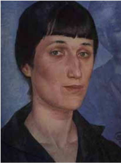
Achmatowa im Jahr 1922, gemalt von Kusma Sergejewitsch Petrow-Wodkin

A nna Andrcjewna Achmatowa war eine bedeutende Dichterin und nach dem Urteil vieler Zeitgenossen eine überwältigend schöne Frau. Wohl jeder, der Nathan Altmans 1914 gemaltes, kubistisch angehauchtes Gemälde betrachtet, das die damals 25-Jährige in einem indigoblauen Kleid zeigt, ahnt, dass die am 23.] uni 1889 in Bolschow Fontan bei Odessa Geborene, deren graugrüne Augen den Dichter Joseph Brodsky an die eines Schneeleoparden denken ließen, ein funkelndes Glanzlicht ihrer Generation gewesen ist. Mit ihren ersten Gedichtbänden „Abend“ (Wjetscher, 1912)