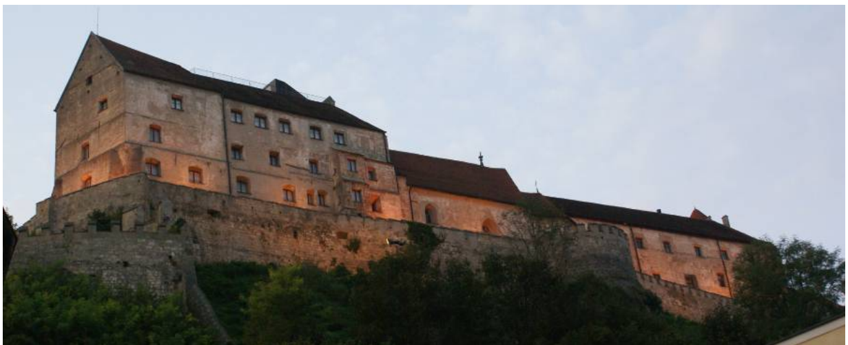
pax christi Wochenende im Zeichen der Burg von Burghausen

Na, toll! Das nur, weil sich die Handelskonzerne einen Krieg liefern.